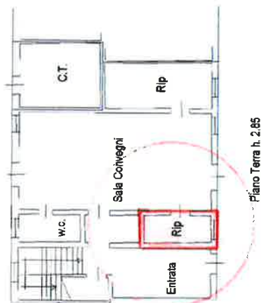
Piano Terra h. 2.85

Compiata da: Genaro Luca Iscritto all'albo: Decorati Prov. Rovigo n. 1175